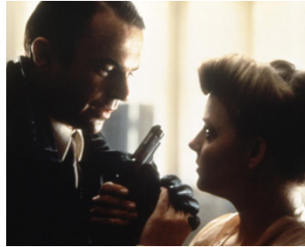
1984 LE SANG DES AUTRES (The Blood of Others) de Claude Chabrol avec Jodie Foster