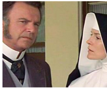
1999 MOLOKAI (Molokai, the Story of Father Damien) de Paul Cox avec Alice Krige