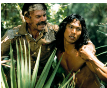
1994 LE LIVRE DE LA JUNGLE (The Jungle Book) de Stephen Sommers avec Jason Scott Lee