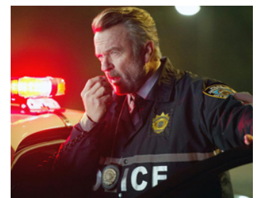
2018 THE PASSENGER (The Commuter) de Jaume Collet-Serra