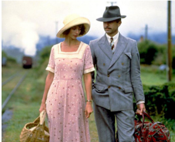
1987 THE GOOD WIFE (The Umbrella Woman) de Ken Cameron avec Rachel Ward