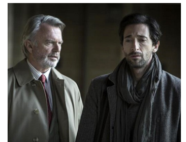
2015 BACKTRACK, LES REVENANTS (Backtrack) de Michael Petroni avec Adrien Brody