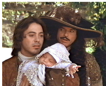
1995 LE DON DU ROI (Restoration) de Michael Hoffman avec Robert Downey Jr