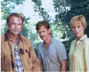
2001 JURASSIC PARK 3 de Joe Johnston avec William H. Macy, Tea Leoni