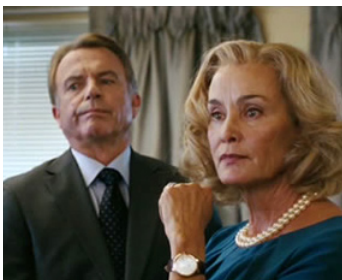
2012 JE TE PROMETS (The Vow) de Michael Suesy avec Jessica Lange