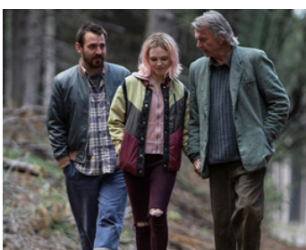
2015 THE DAUGHTER (The Daughter) de Simon Stone avec Ewen Leslie, Odessa Young