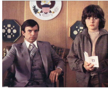
1981 LA MALÉDICTION FINALE (Omen 3, the final Conflict) de Graham Baker avec Barnaby Holm