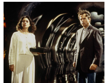
1994 L'ANTRE DE LA FOLIE (In the Mouth of Madness) de John Carpenter avec Julie Carmen