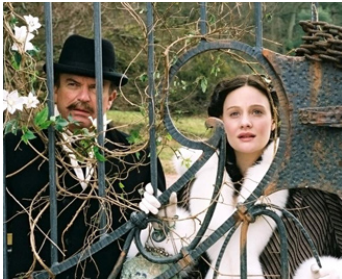
2007 ANGEL (The real Life of Angel Deverell) de François Ozon avec Romolo Garai