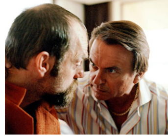
2005 LITTLE FISH (Little Fish) de Rowan Woods avec Hugo Weaving