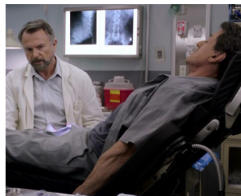
2013 ÉVASION (Escape Plan) de Mikael Häfström avec Sylvester Stallone