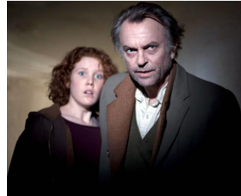
2009 LE SECRET DES SEPT VOLCANS (Under the Mountain) de Jonathan King avec Sophie McBride