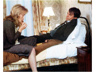
1985 PLENTY (Plenty) de Fred Schepisi avec Meryl Streep