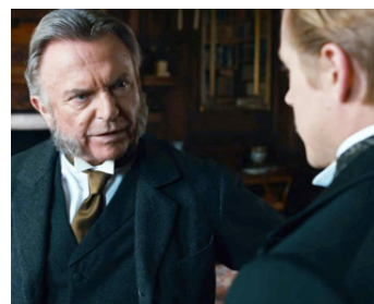
2016 L'HONNEUR DE TOMMY (Tommy's Honour) de Jason Connery avec Jack Lowden