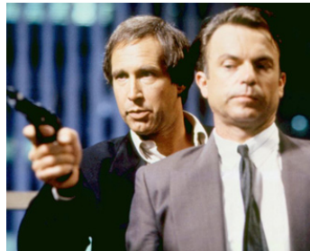
1992 LES AV. D'UN HOMME INVISIBLE (Memoirs of an Invisible Man) de J. Carpenter avec Chevy Chase