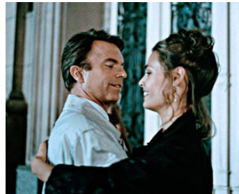
1993 HOSTAGE (Hostage) de Robert W. Young avec Talisa Soto