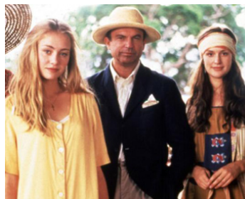
1994 SIRÈNES (Sirens) de John Duigan avec Elle McPherson, Porta di Rossi