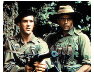
1982 FORCE DE FRAPPE (Attack Force Z) de Tim Burstall avec Mel Gibson