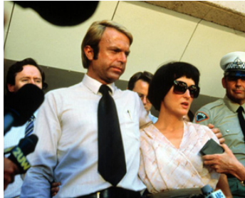
1988 UN CRI DANS LA NUIT (A Cry in the Night) de Fred Schepisi avec Meryl Streep