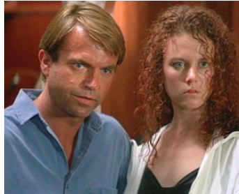
1989 CALME BLANC (Dead Calm) de Phillip Noyce avec Nicole Kidman