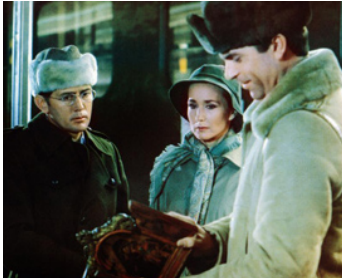
1982 ENIGMA (Enigma) de Jeannot Szwarc avec Martin Sheen, Brigitte Fossey