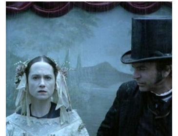
1993 LA LEÇON DE PIANO (The Piano) de Jane Campion avec Holly Hunter