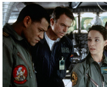
1997 EVENT HORIZON de Paul W. S. Anderson avec Laurence Fishburne, Kathleen Quinlan