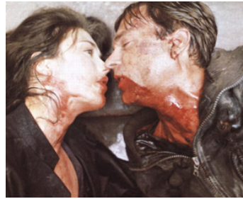
1981 POSSESSION d'Andrzej Zulawski avec Isabelle Adjani