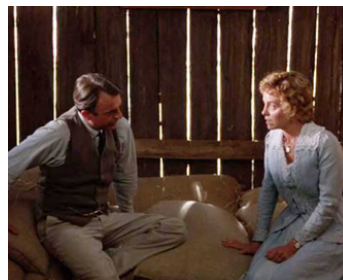
1994 COUNTRY LIFE (Country Life) de Michael Blakemore avec Greta Scacchi