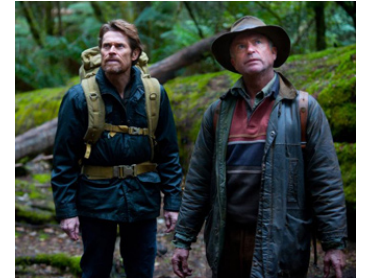
2011 THE HUNTER (The Hunter) de Daniel Nettheim avec Willem Dafoe