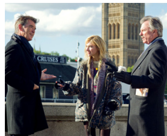
2014 UP AND DOWN (A Long Way Down) de Pascal Chaumeil avec Pierce Brosnan, Imogen Poots