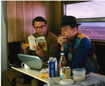
1991 JUSQU'AU BOUT DU MONDE (Until the End of the World) de Wim Wenders avec Rüdiger Vogler