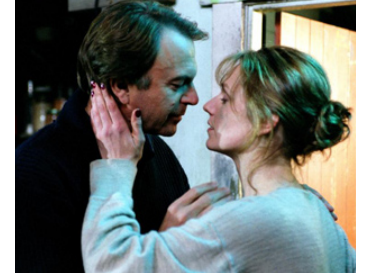
2003 PERFECT STRANGERS (Perfect Strangers) de Gaylene Preston avec Rachael Blake