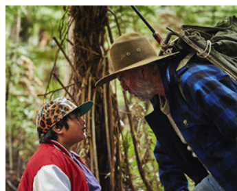
2016 À LA POURSUITE DE RICKY BAKER (Hunt for the Wilderpeople) de Taika Waititi avec J. Dennis