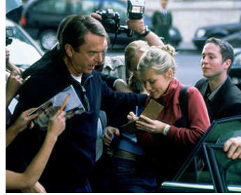
2004 LA PLUS BELLE VICTOIRE (Wimbledon) de Richard Loncraine avec Kirsten Dunst