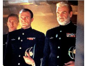
1990 À LA POURSUITE D'OCTOBRE ROUGE (The Hunt for Red October) de J. McTiernan avec Sean Connery