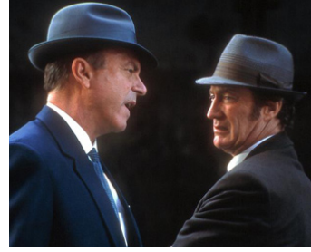
2002 DIRTY DEEDS (Dirty Deeds) de David Zeman avec Bryan Brown