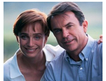
1998 THE HORSE WHISPERER de Robert Redford avec Kristin Scott-Thomas