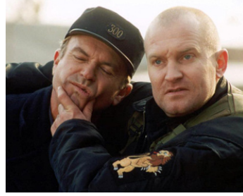
2001 THE ZOOKEEPER (The Zookeeper) de Ralph Ziman avec Ulrich Thomsen