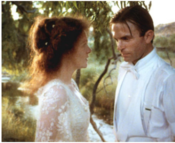
1979 MA BRILLANTE CARRIÈRE (My Brilliant Career) de Gillian Armstrong avec Judy Davis