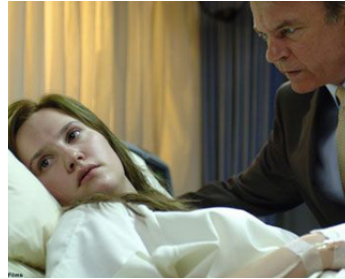
2009 IN HER SKIN (In her Skin) de Simone North avec Ruth Bradley